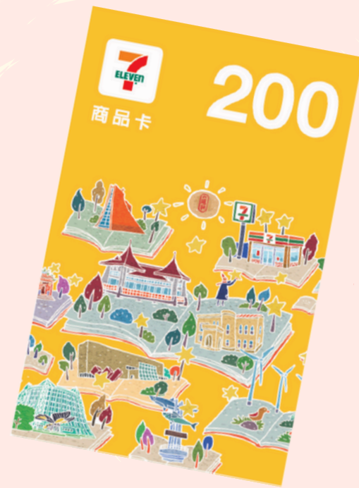
獎品參考圖（限量50份）